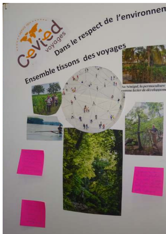
Suggestions de voyages faites de la part des participants : Mexique, Sénégal, Grenoble... Merci !